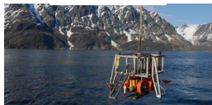
MARINE & MARITIME RESEARCH : A DRIVER OF BLUE GROWTH Welcome address by MEP Gesine MEISSNER